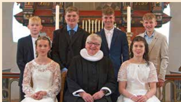
Konfirmation i Bylderup Kirke, søndag d. 3. maj kl. 10.00.

Undervisningen finder sted onsdag eftermiddage i Kirkekroen i Bylderup efter aftale med Bylderup Skole i umiddelbar forlængelse af skoletiden, kl. 13.30 - 15.00. Undervisningen begynder onsdag d. 2. sept. 2026 kl. 13.30 i Kirkekroen, Bylderup. Der er konfirmandpræsentationsgudstjeneste i Bylderup Kirke for alle konfirmander, familie & faddere søndag d. 27. sept. kl. 10.30.