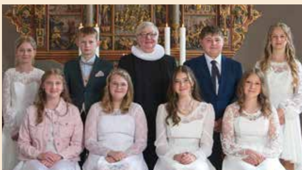
Konfirmation i Burkal Kirke, søndag d. 10. maj kl. 10.00.

Vi har været rundt og spørge de andre konfirmander på holdet om, hvorfor de vil konfirmeres, og de fleste siger, at det er for at bekræfte den kristne tro. Nogle siger, at det er for oplevelsens skyld og andre, at det er for at sige ja. Og så var der nogle, som sagde, at det var for familiens skyld eller for pengene.