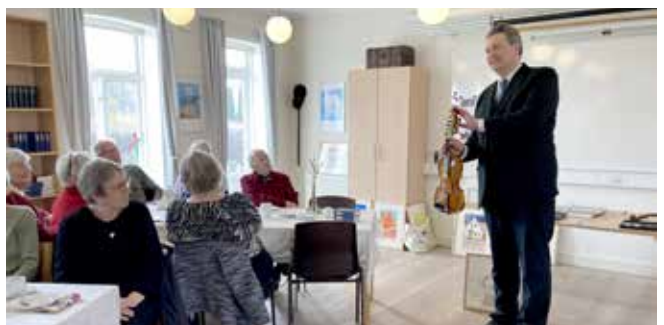
Sogneeftermiddag med Rune Rotevatn