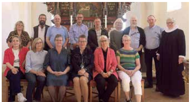
Guldkonfirmanderne fra Bylderup Kirke